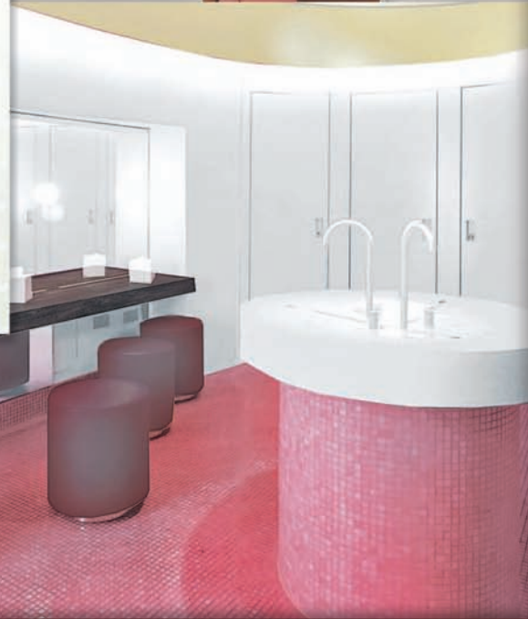
VIBA Family Center. Erdgeschoss.