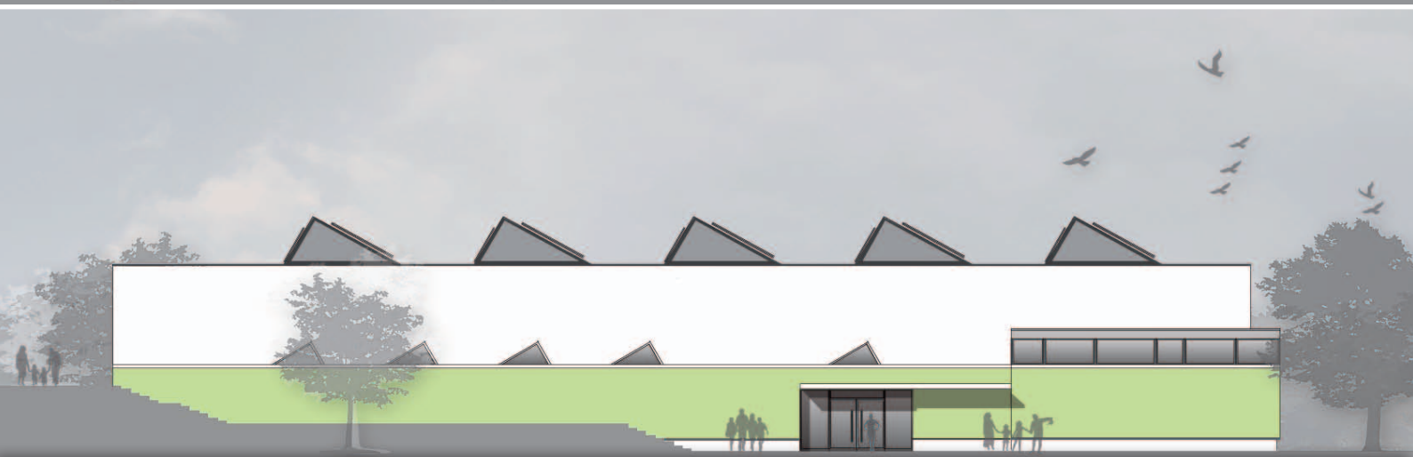
Dreifeldturnhalle. Schnitt / Grundriss.