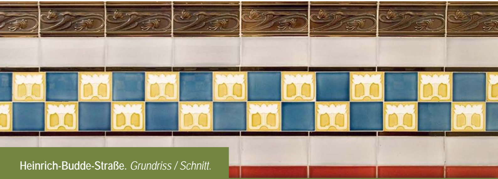
Heinrich-Budde-Straße. Grundriss / Schnitt.