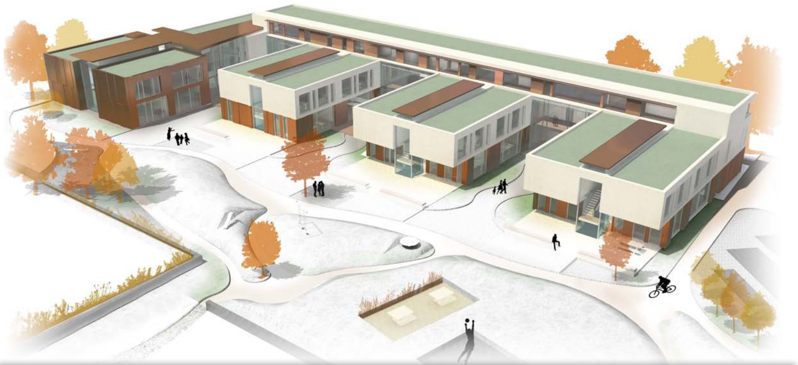
Grundschule Nord. Lageplan.